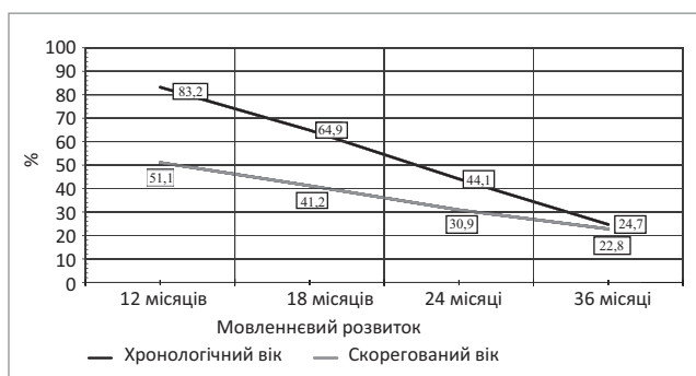
Рис. 1. Динаміка кількості дітей із затримкою мовленнєвого розвитку

з 12 місяцями, частка таких дітей зменшувалася, але це зменшення не мало статистичної значущості ( p=0,029 ). Як видно з рис. 1, кількість дітей із затримкою МР у 24 місяці ХВ становила 44,1%, а у 24 місяці СВ – 30,9%. У 36 місяців частки дітей із затримкою МР зменшилися (відповідно p=0,001 та p=0,058 ), але залишалися високими, – 24,7% та 22,8% дітей.