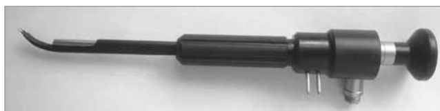
Рис. 5. Біполярний пристрій для коагуляції з ендоскопом

струкції (патенти України на винахід № 91640, № 96641) [8,9] (рис. 2, 3).