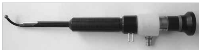
Рис. 4. Оптичний біполярний електропристрій для коагуляції тканин