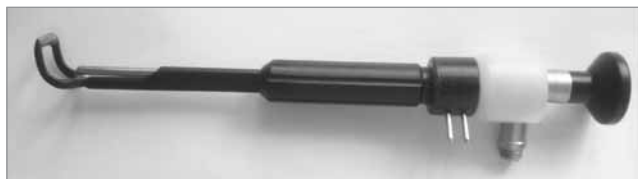
Рис. 3. Біполярний аденотом Косаковського—Семенова з ендоскопом