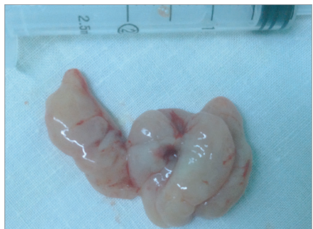
Рис. 3. Пухлиноподібне утворення носоглотки