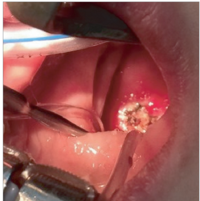
Рис. 2. Місце фіксації ніжки ангіоматозного поліпа у носоглотці