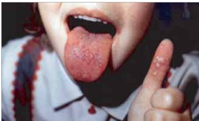
Рис. 1. Синдром «рука—нога—рот» (Е.П. Кишкурно, Т.В. Амвросьева, 2007 р.)

мічні спалахи ЕВІ останніми роками реєструються в Китаї [25].