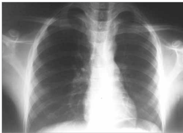
Рис. 1. Рентгенографія органів грудної клітки