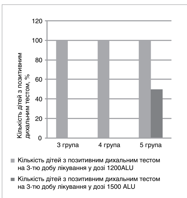
Рис. 3. Оцінка ефективності застосування ферменту лактази у дозі 1500 ALU на годування у дітей з ТЛН, що мали показники ВДТ >40 ppm