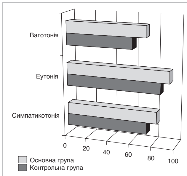
Рис. 2. Оцінка виразності вегетативного тону

У всіх, без винятку, дітей реєструвались ті чи інші розлади вегетативного статусу. При оцінці вихідного вегетативного тону дітей (табл.) було виявлено, що стан еутонії мали 26% дітей основної та 34% дитини контрольної групи. Найбільша частка в основній групі припадала на ваготонію (48%), тоді як у контролі така частка сягала лише 18%. У дітей контрольної групи превалювала симпатикотонія (48%), що можна вважати варіантом фізіологічної норми.