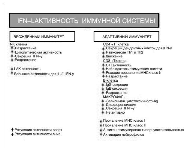
Рис.1. Биологические эффекты альфа 2b интерферонов [2]

В ряде исследований было установлено, что вирусы некоторых возбудителей, в частности гриппа и РС-инфекции, обладают способностью подавлять защитное действие интерферонов. Обнаружен ряд механизмов такого