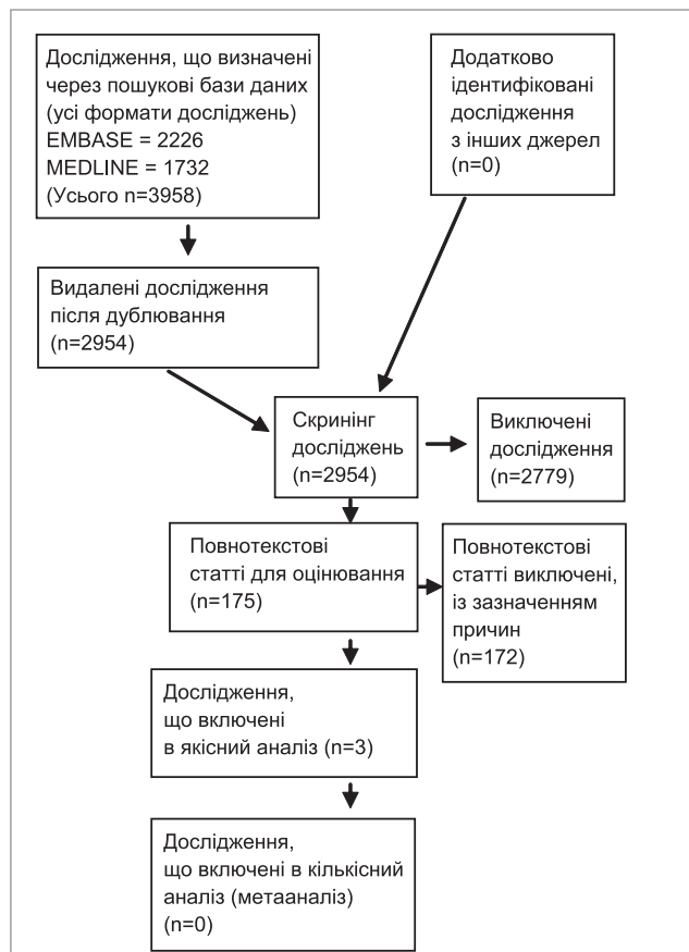
Рис.14.2. Відбір обсерваційних досліджень щодо ефективності заміників коров'ячого молока

Не виявлено досліджень щодо порівняння амінокислотної суміші із соєвою чи гідролізованою рисовою сумішами. У двох дослідженнях порівнювалися суміші на основі гідролізованого коров'ячого білка (Nutramigen regular – Mead Johnson і Peptidi-Tutteli – Valio) із соєвою сумішшю (Isomil-2 – Ross Abbott і Soija Tutteli – Valio) [104,105]. Усі дослідження мали методологічні обмеження: вони не були сліпими, не вказані методи рандомізації і розподілу хворих.