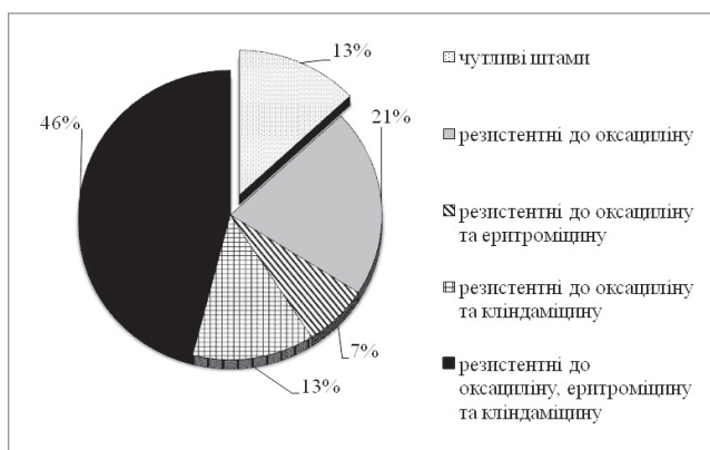
Рис. 1. Профілі резистентності Streptococcus pneumoniae , виділеного у дітей з гострим обструктивним бронхітом, до антибіотиків

Беручи до уваги одержані дані стосовно чутливості основних збудників, препаратами вибору є цефалоспорино III покоління. Таким препаратом для лікування гострих обструктивних бронхітів у дітей, який відповідає усім вищезазначеним вимогам, є антибіотик цефподоксима проксетил («Цефодокс») [3]. Препарат активний щодо грампозитивної і грамнегативної флори. Особливості фармакокінетики препарату забезпечують збереження необхідної концентрації діючої речовини в плазмі крові протягом 12 годин, що обумовлює можливість ерадикації збудників [1,10]. Його бактерицидний ефект обумовлений пригніченням синтезу компонентів бактеріальної стінки мікроорганізмів. Цефподоксима проксетил – препарат, створений за технологією PRODRUG, тобто це – проліки, які стають активними лише в стінці тонкої кишки, де вони перетворюються на активну форму, тобто цефподоксим. Означена технологія дозволяє підвищити біодоступність препарату та мінімізує низку побічних дій, що притаманні антибактеріальним препаратам, зокрема порушення мікробіоценозу шлунково-кишкового тракту. Крім того, технологія PRODRUG дозволяє підвищити